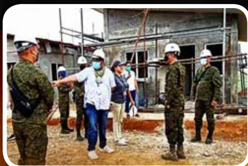
03 Payapa at Masaganang Pamayanan (PAMANA) sa Kabisayaan: Isang Tagumpay Laban sa Insurhensiya sa Makabagong Panahon