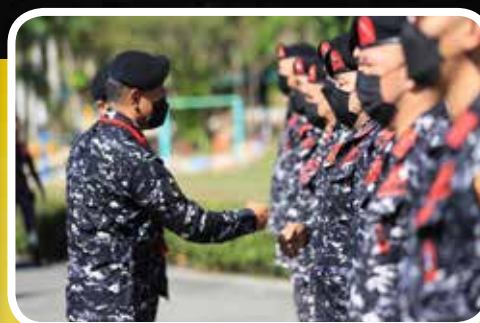
08 Pinunong Heneral Bilang Pinunong Tagapaglingkod