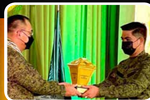
10 552ECB: Paglalakbay Tungo sa Tunay na Pagbabago