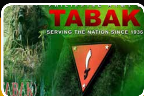
05 Pagsusumikap ng Tabak sa Pagbabagong Ganap Tungo sa Kapayapaang Hanap