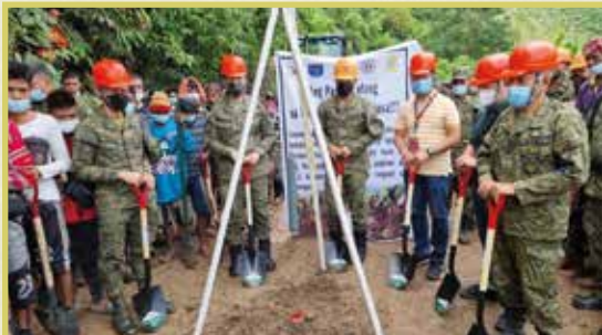
Groundbreaking Ceremony ng 27.2 kilometrong maliit na kalsada na tinatawag na panpan ng mga katutubo sa So. Nasilaban, Talaingod, Davao del Norte.

Hindi lamang paggapi sa mga armadong grupong NPA ang tanging solusyon sa pagpupulbos ng Komunismo Terorismo sa bansa, sa pamumuno ni Presidente Duterte, naibaba nito ang Whole of Nation Approach to End Local Communist Armed Conflict at naipatupad ang mga programa nito sa pamamagitan ng binuong National Task Force at mga Regional, Provincial at Municipal Task Forces. Katuwang ng mga task forces na ito ang 10ID sa lahat ng aktibidad at proyektong naisakayuparan.